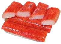
Surimi chunks Red & Surimi, "maki". Chunks: IQF & Vacum pokar Maki: 18 cm, red, (sushi).