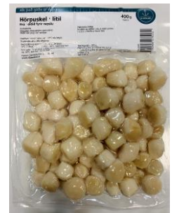
Hörpuskel / lítill