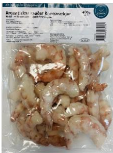
Argentísk rækja / hrá