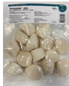
Hörpuskel / stór