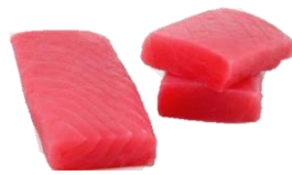
Túnfiskur YF. Saku fyrir Nigiri.