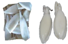
Smokkfiskur heill. U1 Smokkfiskur Bolir. U-10