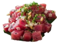
Tuna Poke YF. Túnfisk-bitar, stærð 1,5*1,5 cm.