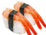
Ama Ebi rækja.