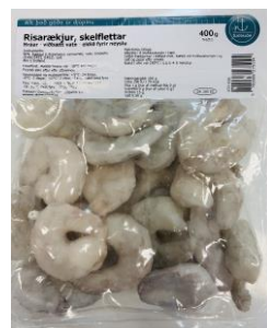
Risarrækja / skelflett