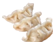
Gyoza / Dumplings. Með kjúkling, grænmeti eða önd. 20 g/stk.