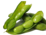
Edamame baunir. Heilar og lausar