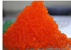
Masago og Tobiko Rautt, svart, orange & grænt. 500g í dós.