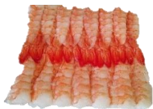
Sushi-rækja. EBI. 3L & 4L.