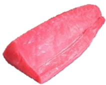
Túnfiskur YF. Lundir 2-5 kg & Steikur 170-230 g.