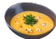
Humar & Grjótakrabbasoð. 9 ltr. Í fötu