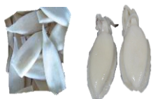
Smokkfiskur heill. U1 Smokkfiskur Bolir. U-10 & U-5