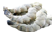
Risa / Tigrisrækja PDTON. Skelflett með stéli. Stærðir 21/25 & 26/30.