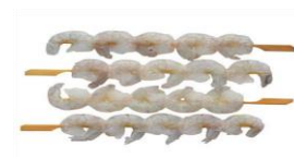
Risarækju-spjót. 100 g