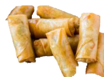
Vorrúllur með önd & vorrúllur með Grænmeti. 20g./stk. 50 stk í pakka