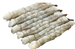
Nobashi rækja. Stærð 4L, ASC. Hrá.