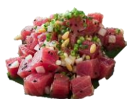
Tuna Poke YF. Túnfiskbitar, stærð 1,5*1,5 cm.