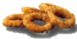
Smokkfiskur. Hringir í Orly hjúp.