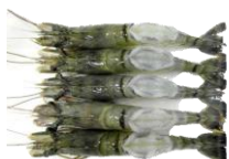
Tigrisrækja. Heil og heil boddy peeled.