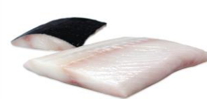
Black Cod fillets. – NÝTT