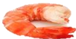
Argentísk rækja. Hrá. heil með haus & hala. Einnig skelflettir halar hráir.