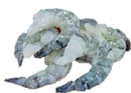
Risarækja / Tigrisrækja PD. Skelflett, stærðir 13/15, 16/20, 21/25, 26/30 & 31/40