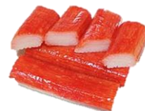
Surimi," maki sticks". 18 cm, red, (sushi).