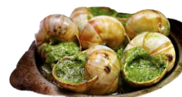
Sniglar í hvítlaukssmöri.