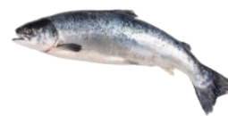
Lax heill, Landeldi.