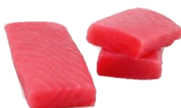
Túnfiskur YF. Saku fyrir Nigiri.