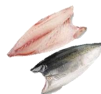
Hamachi/yellow tail. King fish FILLETS.