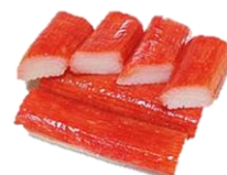
Surimi," maki sticks". 18 cm, red, (sushi).