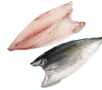
Hamachi / yellow tail. King fish FILLETS.