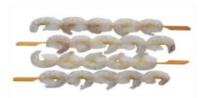
Risærækju-spjót. 100 g