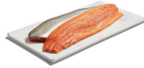
Bleikju flök. Fersk og Reykt. Með roði beinlaus