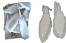
Smokkfiskur heill. U1 Smokkfiskur Bolir. U-10 & U-5 Sölueining: 10*1 kg / ks.