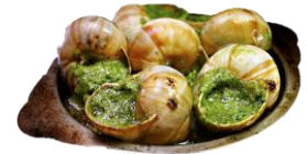
Sniglar í hvítlaukssmöri.