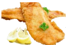
Þorskbítar í orly. Forsteiktir. IQF. Sölueining: 5 kg í kassa