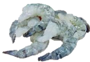
Risærækja / Tigrisrækja PD. Skelflett, stærðir 13/15, 16/20, 21/25, 26/30 & 31/40 Sölueining: 10 x 1 kg.