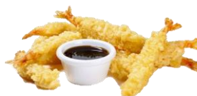
Rækja í tempura. St. 21/25 & 26/30