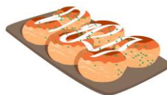
Takoyaki Bollur, Kolkrabba bollur "Japanese street food" Sölueining: 20 stk á bakka.