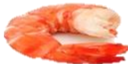
Argentísk rækja. Hrá. heil með haus & hala. Einnig skelflettir halar hráir.