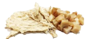
Hákarl - kæstur & Harðfiskur. Roð- & beinhreinsaður. Sölueining: 200 g í poka