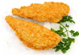
Þorskbítar í Pankó raspi Forsteiktir. IQF. Sölueining: Mismunandi