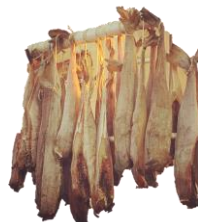
Siginn fiskur. Sölueining: mismunandi