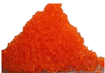
Masago og Tobiko. Rautt, svart, orange & grænt