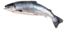
Lax heill, Landeldi.