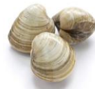
Clams / Brimskel