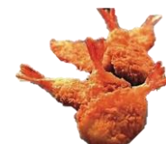
Butterfly rækja í Pankó raspi