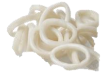
Smokkfiskur. Hringir Sölueining: 10*1 kg / ks.