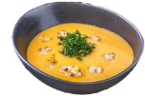
Humar & Grjótakrabba soð. 9 ltr. Í fötu