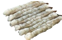
Nobashi rækja. Stærð 4L, ASC. Hrá.