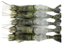
Tigrisrækja. Heil og heil boddy peeled.