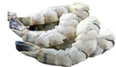
Risa / Tigrisrækja PDTON. Skelflett með stéli. Stærðir 21/25 & 16/20.