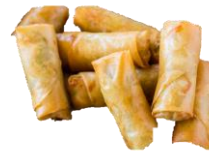
Vorrúllur með önd. 20g./stk. Vorrúlludeig. Pastry spring