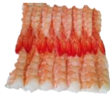
Sushi-rækja. EBI. 3L & 4L.