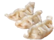
Gyoza / Dumplings. Með kjúkling, grænmeti eða önd. 20 g/stk.