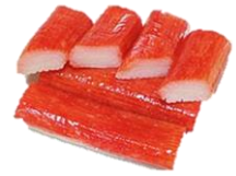
Surimi," maki". 18 cm, red, (sushi).