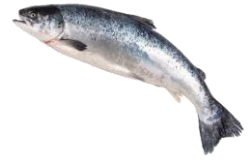
Lax & bleikja. Heil og fersk.