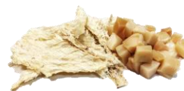
Hákarl vel kæstur.