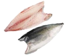
Hamachi/yellow tail. King fish FILLETS.