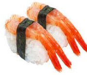
Ama Ebi rækja.